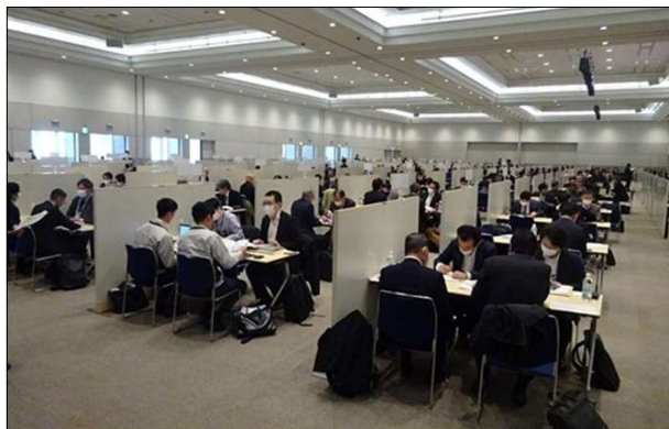
令和5年度に実施した「九都県市合同商談会2024」の商談風景 (会場:パシフィコ横浜 アネックスホール)

首都圏産業の国際競争力の強化を図るため、平成20年度から九都県市(埼玉県、千葉県、東京都、神奈川県、横浜市、川崎市、千葉市、さいたま市、相模原市)が連携して合同商談会を開催し、今回で17回目を迎えます。